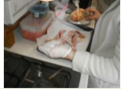
お正月のおやつを試作（タルトタタン）と試食会風景。 クリスマスの鶏を焼く準備中のスタッフ。